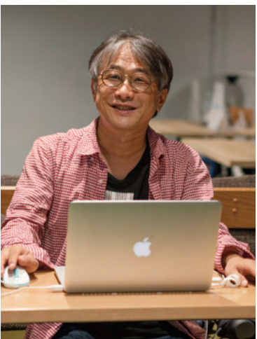
取材: 文: 金城実来

学生時代は予備校の先生になりたいと思っていました(笑)。今はデザインスクールの講師業務もしているので、結果的に戻ってきた感じですね。講師業務は、ティーチングよりコーチングの方が好きです。同じことを同じように教えても、同じように伝わるとは限らないので生徒と話してから方針を決めています。話している中で生まれたアイデアを、どんどんぶつけてきて欲しいです。